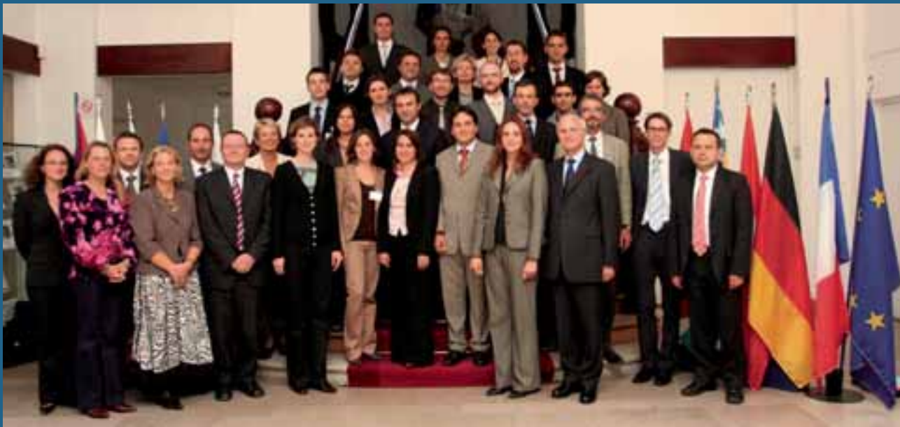
Promotion 2007-2008 du Master européen de gouvernance et d'administration